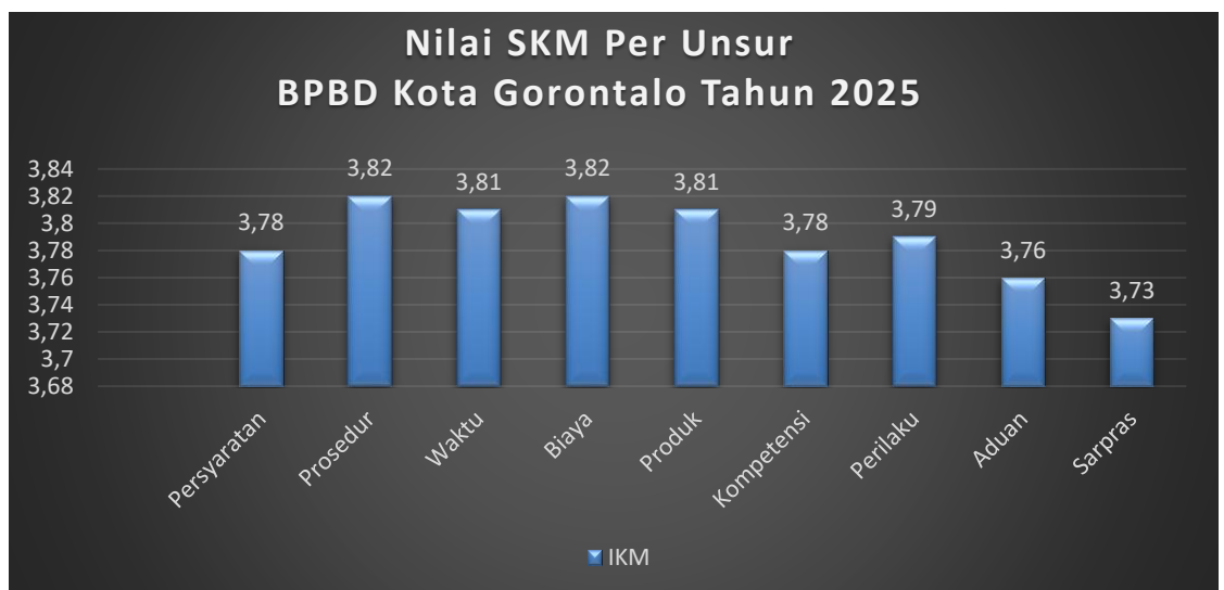
Gambar 1. Grafik Nilai SKM Per Unsur